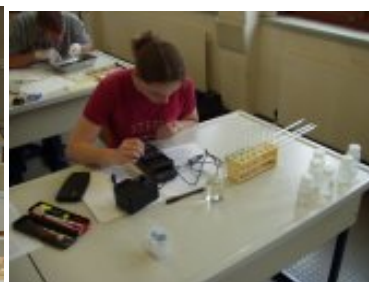
NAWI SCHW CH

Die Korrektur brachte keine wesentlichen Abweichungen der Beurteilungen von den Jahresnoten. Das Punkteschema erwies sich zwar als sehr hilfreich, jedoch muss die Änderung der Punkteverteilung neu überlegt werden. Ebenfalls werden die Dauer der Schriftlichen Reifeprüfung und die Zeitaufteilung für den theoretischen bzw. praktischen Teil erneut diskutiert und evtl. modifiziert.